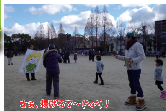
さあ、揚げるで～(ノノ)!

はぐくみ、いきいき、子ども会、PTA!今年最初のイベントはやっぱりこれ。たこ作り教室!今回も50名を越す子どもたちと、いきいきの先生がた、付き添いの保護者の皆さん、そして榎本ダンディーズ!2階の多目的室もお借りして大入り満員、大騒ぎのたこ作り。真剣な子どもたち、難しいところは大人が手伝いますが、その手にも思わず熱が入り…。他のイベントでも、何度も顔を合わすうち、地域の皆さんと子どもたち、そしてその保護者の皆さんともなるとななく顔見知りになっちゃいました。催しそのものを楽しむことと、そして、お知り合いが増えること。これが地域行事の目指すところ。さて、出来上がり～!