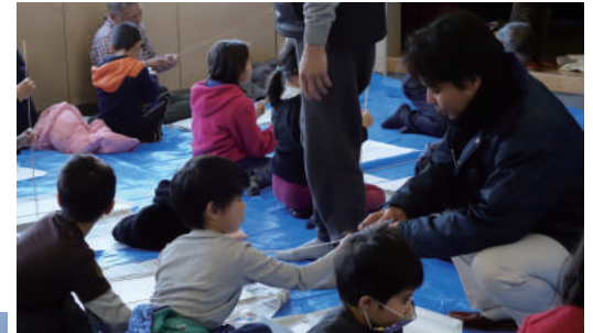
パパたちも榎本ダンディーズも大活躍