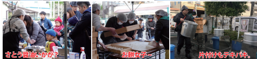
さとう醤油いかが?