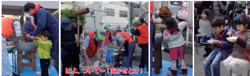
はよ、ついて～!まかせとけ!

カラリと晴れ!今年を締めくくるとはすっかり恒例、ふくの日餅つき大会!前日からの準備も余念なく、朝は9時にスタッフが集合。残りの準備を整えて11時スタート!早くから、お餅をつきたい子どもたちが列を作り、楽生会の皆さんの手を借りつつ、重い杵を振り下ろしました。砂糖醤油に、きなこにぜんざい。つきたてのお餅を思い思いにほおばって、長い行列やぎゅうぎゅうの椅子席にも関わらず、賑やかな笑い声が溢れました。80キロのもち米は、さすがにつきごたえがあって、3つの石臼はフル回転。ちぎり手も立ちっぱなしの大活躍。いったい何人の方が来られたのか、顔を上げる間もない忙しさ!本当に大勢の方のお腹に、お餅が収まったことは確か。ノ口の流行で、取りやめになった行事も多いと聞きましたが、こうして美味しい顔と、その顔にカメラを向ける保護者のみなさんの姿は、寒い冬の日の陽だまりのようでした。