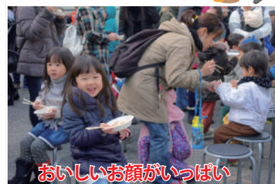
おいしい顔がいっぱい

カラリと晴れ!今年を締めくくるとはすっかり恒例、ふくの日餅つき大会!前日からの準備も余念なく、朝は9時にスタッフが集合。残りの準備を整えて11時スタート!早くから、お餅をつきたい子どもたちが列を作り、楽生会の皆さんの手を借りつつ、重い杵を振り下ろしました。砂糖醤油に、きなこにぜんざい。つきたてのお餅を思い思いにほおばって、長い行列やぎゅうぎゅうの椅子席にも関わらず、賑やかな笑い声が溢れました。80キロのもち米は、さすがにつきごたえがあって、3つの石臼はフル回転。ちぎり手も立ちっぱなしの大活躍。いったい何人の方が来られたのか、顔を上げる間もない忙しさ!本当に大勢の方のお腹に、お餅が収まったことは確か。ノ口の流行で、取りやめになった行事も多いと聞きましたが、こうして美味しい顔と、その顔にカメラを向ける保護者のみなさんの姿は、寒い冬の日の陽だまりのようでした。